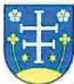
OBEC KRÁSNOHORSKÉ PODHRADIE

V modrom štíte nad zlatým návrším medzi dvoma zlatými vyrastajúcimi štvorlúpeňovými striebrostredými kvetmi strieborný dvojité barličkový kríž s kratšími dolnými ramenami, sprevádzaný dolu pri päte dvoma zlatými hviezdami, v horných rohoch po jednej striebornej zlatostredej bezkališnej ruži.